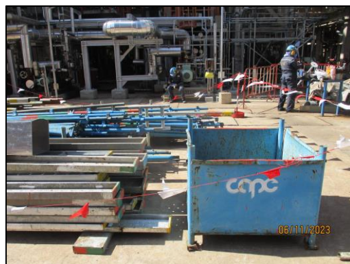
รูปที่ 2-18 พื้นที่วางอุปกรณ์ในการทำงาน