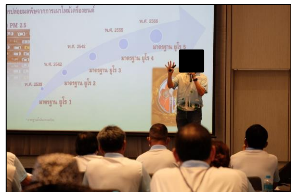
รูปที่ 2-21 กิจกรรมลงพื้นที่ชุมชน