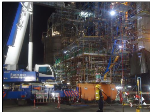
รูปที่ 2-17 ไฟส่องสว่างช่วงเวลากลางคืน