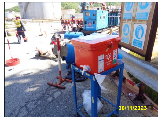
รูปที่ 2-8 น้ำดื่มสะอาด สำหรับคนงาน