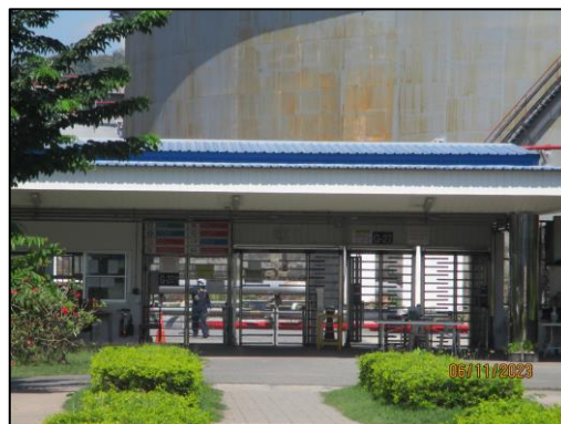
รูปที่ 2-13 บริเวณเข้า-ออกพื้นที่โครงการ