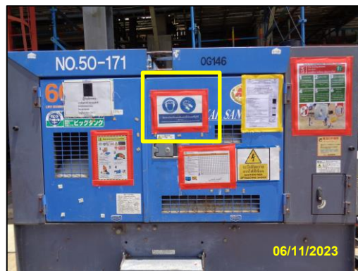
รูปที่ 2-4 ป้ายเตือนการสวมใส่อุปกรณ์ป้องกันเสียง