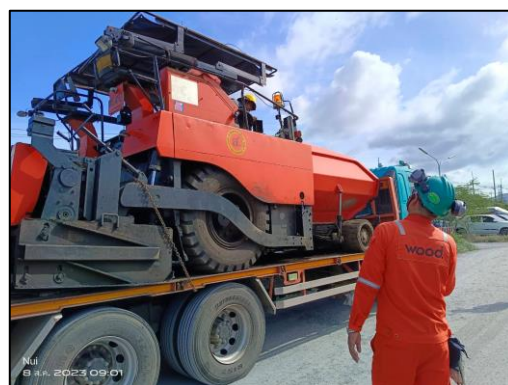
รูปที่ 2-5 กิจกรรมอบรมพนักงานขับรถ