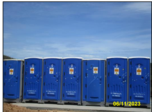
รูปที่ 2-16 ห้องน้ำ-ห้องส้วม