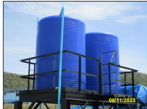
รูปที่ 2-19 ถังสำรองน้ำใช้ บริเวณพื้นที่ก่อสร้าง