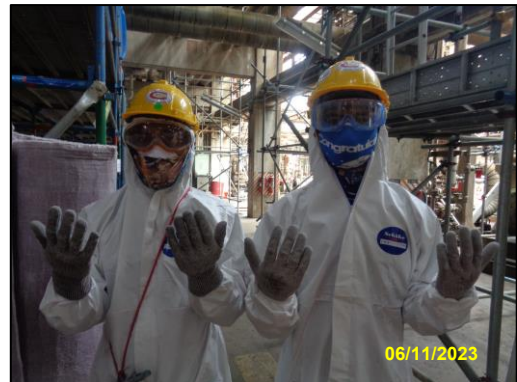
รูปที่ 2-15 พนักงานสวมใส่อุปกรณ์ป้องกันอันตรายส่วนบุคคลขณะปฏิบัติงาน