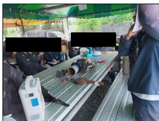
รูปที่ 2-14 กิจกรรมอบรมความปลอดภัยให้แก่คนงาน