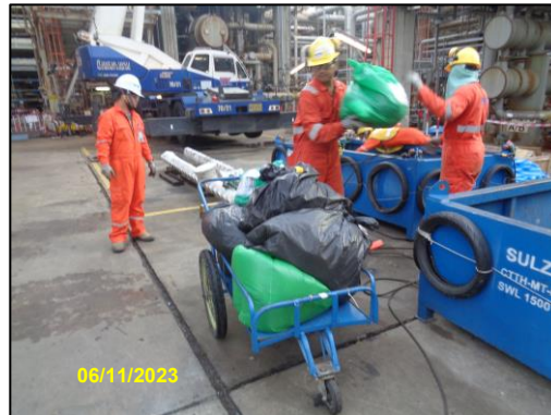
รูปที่ 2-7 เจ้าหน้าที่รวบรวมของเสียออกจากพื้นที่