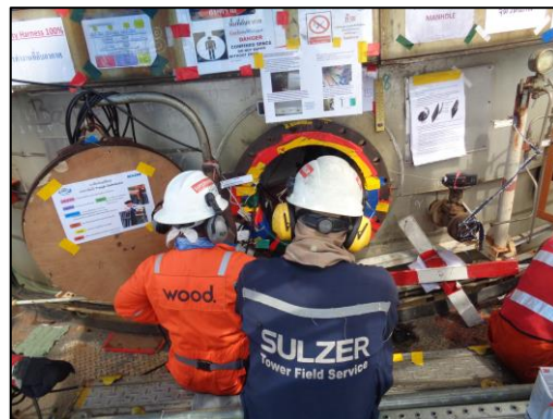
รูปที่ 2-3 อุปกรณ์ป้องกันเสียง