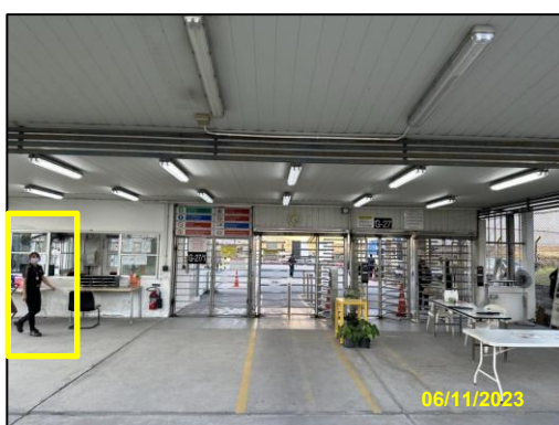
รูปที่ 2-12 เจ้าหน้าที่รักษาความปลอดภัย