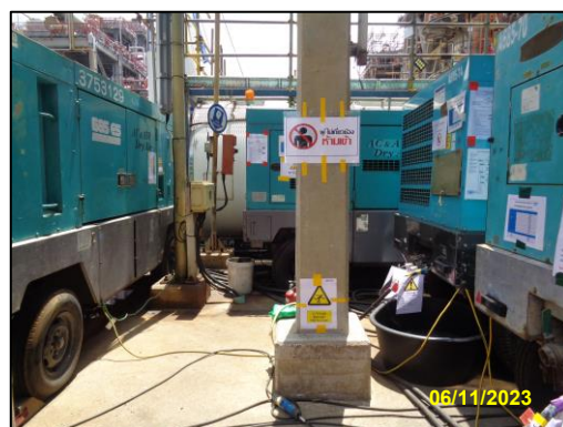
รูปที่ 2-11 ป้ายเตือนบริเวณที่อาจเกิดอันตราย