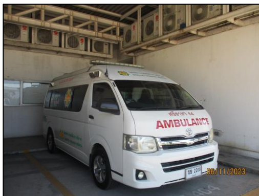
รูปที่ 2-10 รถฉุกเฉิน