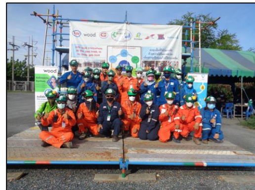
รูปที่ 2-20 เจ้าหน้าที่ความปลอดภัยประจำโครงการ