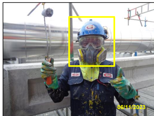
รูปที่ 2-2 อุปกรณ์ป้องกันฝุ่นละออง