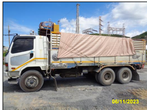
รูปที่ 2-1 การปิดคลุมส่วนบรรทุกของรถบรรทุกวัสดุก่อสร้าง