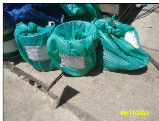
รูปที่ 2-6 ภาพขณะรองรับมูลฝอยภายในพื้นที่โครงการ